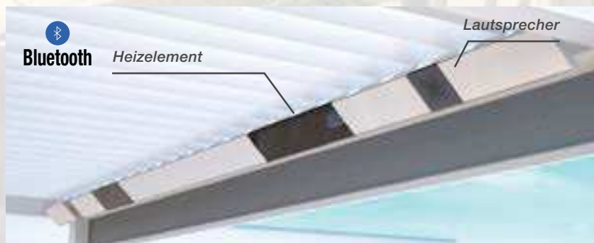
Integrierte Heizelemente und Lautsprecher