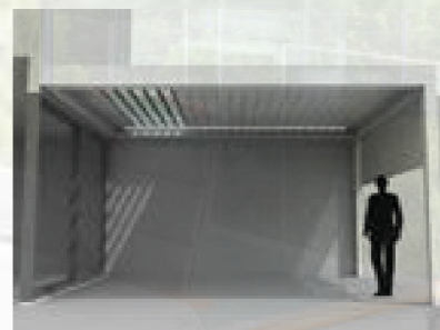
Licht in der Wohnung bei geschlossenem Dach

Ideal, wenn auch bei geschlossenem Dach Licht einfallen soll!