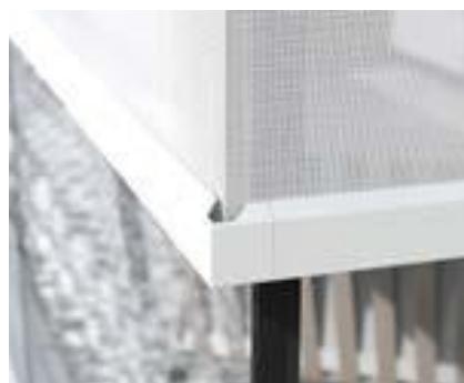
Panovista® Max (mit mittleren Reißverschluss)