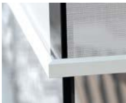
Panovista® (ohne mittleren Reißverschluss)